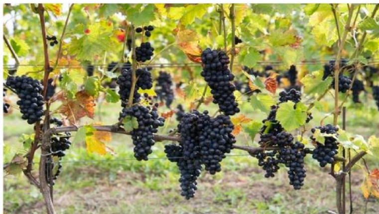
Gotländsk vinodling. Gårdsförsäljning i norr handlar mer om mikrobryggerier av öl eller destillering av spritdrycker.

Ledarsidans krönikor och ledarcitat samt nyhetsartiklarna som berör gårdsförsäljning gav i de flesta fall en positiv bild, 7 hade argument för gårds-