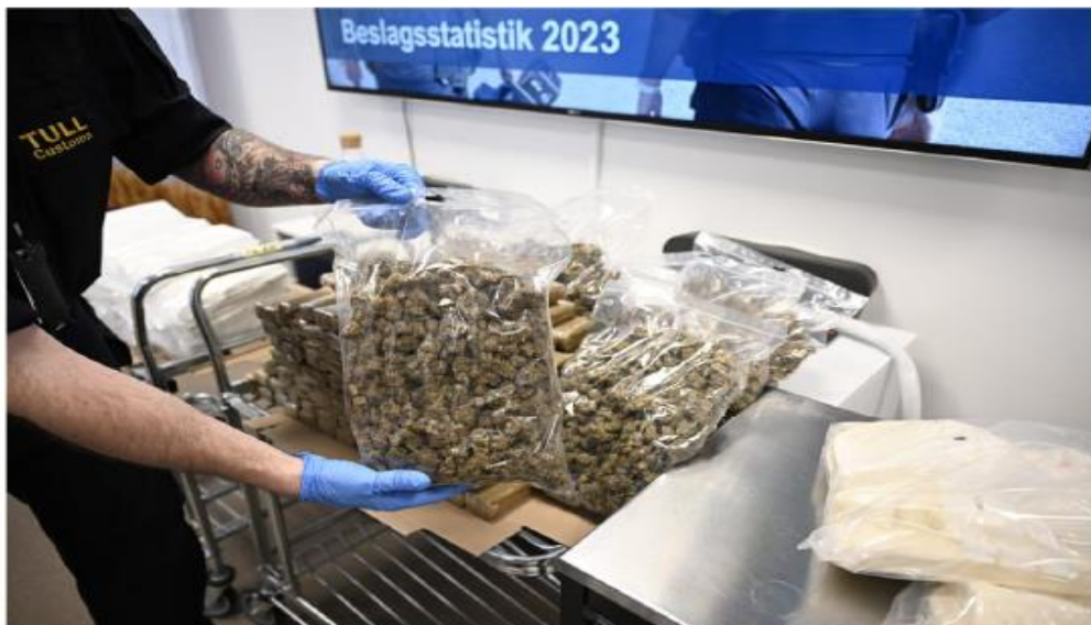
Beslagtagn cannabis. Arkivbild.

Trots varnande exempel från flera länder hörs allt mer ofta förslag om att legalisera cannabis, ibland även annan narkotika. Från Västerbottens läns nykterhetsförbund genomförde vi därför i höstas en undersökning om västerbottningars