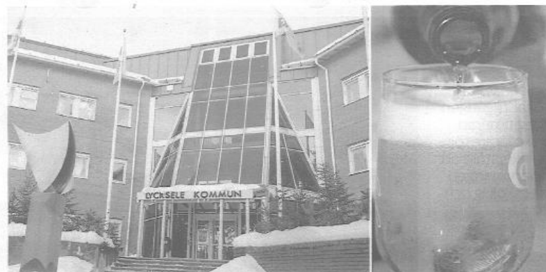
Lycksele kommun har fått omfattande kritik för att inte sköta tillståndsärenden och tillsyn enligt alkohollagen. Oacceptabelt, anser debattörerna.

Av FHM:s senaste länsrapport om alkoholtillsyn (2024) framgår att tre av länets kommuner överhuvudtaget inte svarat på FHM:s frågor om sin tillsyn av serveringsställen. Andra som svarat saknade tillsynsplan.