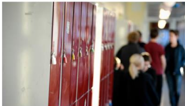
Skolan är en viktig arena för både förebyggande insatser, skriver debattörerna.

Skolan är en viktig arena för både förebyggande insatser och tidig upptäckt. Trots det upplever många skolor att det finns brister