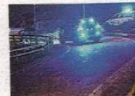
Mer måste göras mot drograttfylleri, arser insändarskribenterna.

Även om situationen inte är lika alarmant i Sverige som i många andra länder, visar även dessa data från