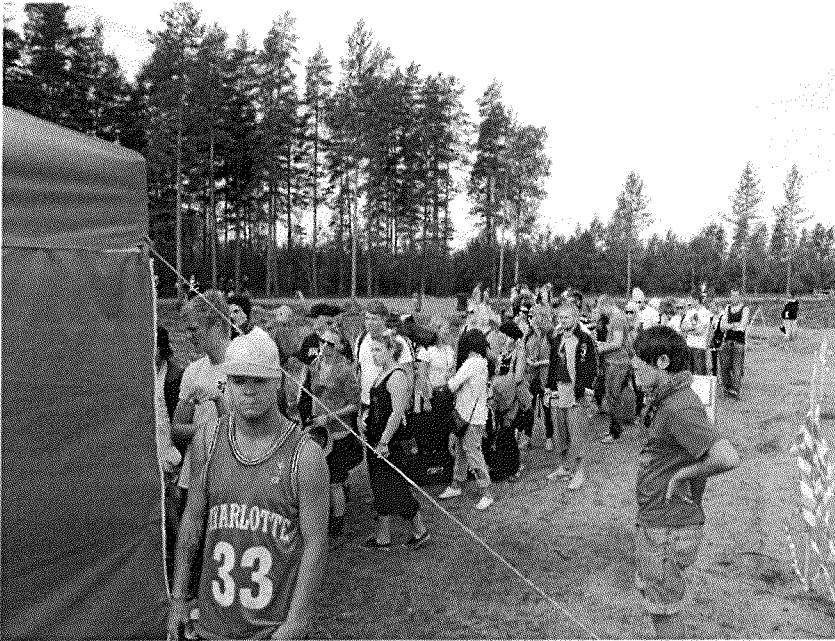
Kön till provtagningen var konstant under många timmar.