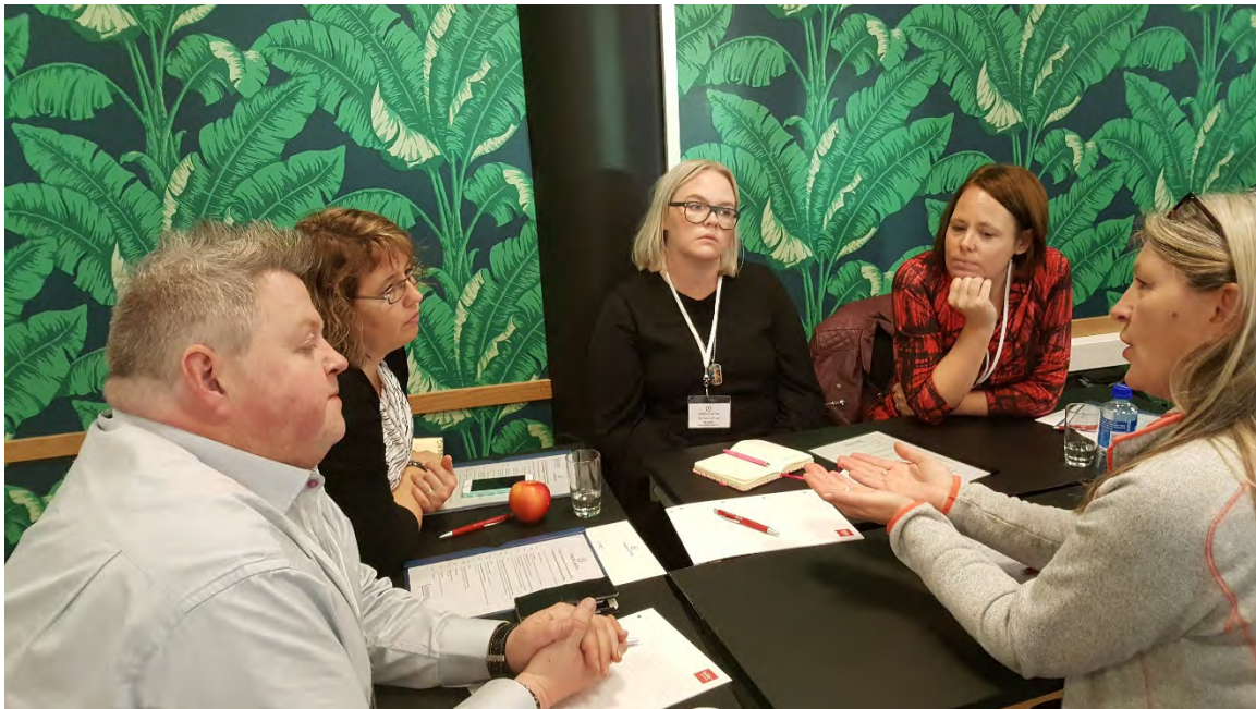
Alvorlige diskusjoner blant nordiske kolleger.